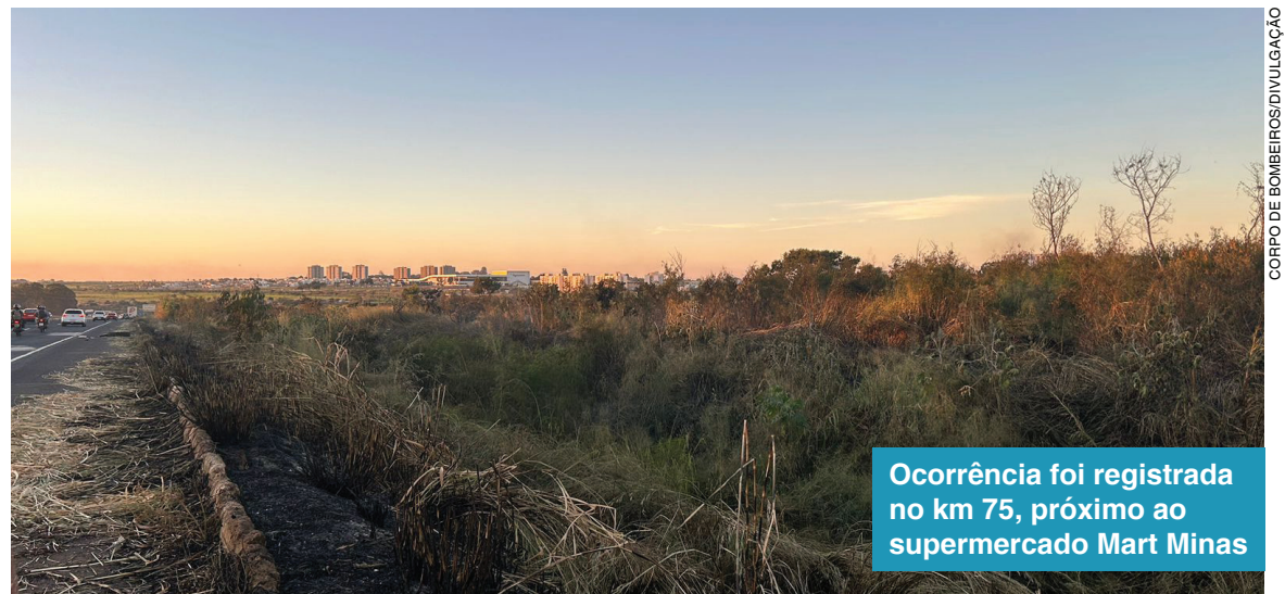
Ocorrência foi registrada no km 75, próximo ao supermercado Mart Minas

Segundo informações do Corpo de Bombeiros, a ocorrência foi registrada no km 75, próximo ao supermercado Mart Minas. O fogo queimou cerca de 4.000m 2 e o trabalho de combate ao incêndio durou cerca de três horas.