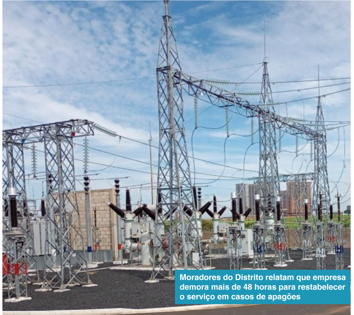
Moradores do Distrito relatam que empresa demora mais de 48 horas para restabelecer o serviço em casos de apagões

Durante uma audiência realizada no MPE, dois proprietários rurais de Miraporanga relataram que as quedas de energia na região são constantes e que, na maioria das vezes, a Cemig demora mais do que 48 horas para restabelecer o serviço. Dessa forma, o ministério acredita que a empresa deve ser responsabilizada, já que os apagões causam danos